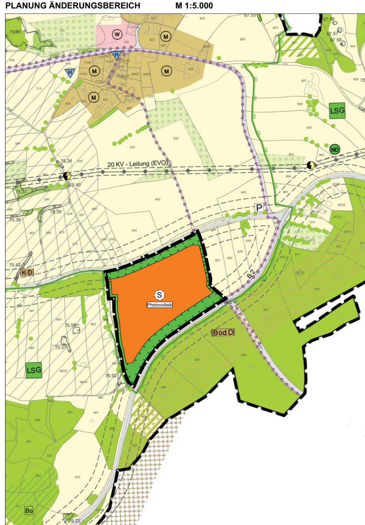
Kartengrundlage: Gültiger Flächennutzungsplan, digitalisierte Fassung